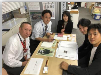
11月19日の打ち合わせ風景です

そんな、福島の「熱い気持ち」を多としてくださり、福島市への全面的なご支援をお約束頂きました。