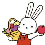
規格外りんごや剪定枝を希望する事業者へお届け