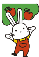
農業体験ボランティア

農業手伝い者を移住希望者や市内外の方から希望者を募って実施致します。農作業だけではなく、情報発信のお手伝いなどもして頂きます。このお手伝いの方々が、農家手伝い後に規格外りんごや剪定枝を希望する飲食店や宿泊施設へ届けします。届けてくれたお礼にお手伝い者へ割引サービスなどのおもてなしを提供頂けましたら大変ありがたいです。消費者が畑と事業者の取り組みを知る機会を作り、関係人口を増やし、地域に資源を循環させる取り組みの1つにして参りたいと考えております。