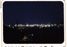
市街灯を見下ろすと夜景がキレイ!

吾妻エリアは福島市街地より標高が高く、西を望むと「雪うさぎ(種まきウサギ)」を擁する吾妻連峰、東を見下ろすと福島の街並みと美しい景色を見られるのも魅力のエリア。おすすめのビュースポットもご紹介します。