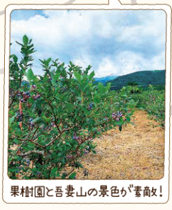
果樹園と吾妻山の景色が素敵!