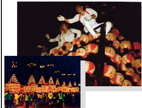
松川提灯祭り 場所：中町通り・県道土湯温泉線等 時期：10月第2日曜