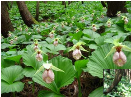
⑩クマガイソウの里まつり 特徴：絶滅危惧種 時期：5月中旬～下旬