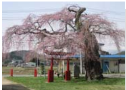
⑨西郷の夫婦桜 見頃：4月中旬