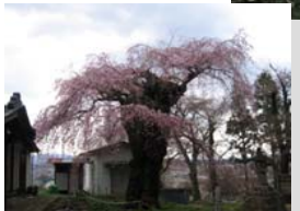
⑧諏訪山の桜 見頃：4月中旬