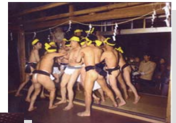
①黒沼神社の祭り 上)金沢羽山ごもり (国無形民俗文化財) 時期：旧暦11月16～18日 左)黒沼神社十二神楽 (県重要無形文化財) 時期：4月第1日曜