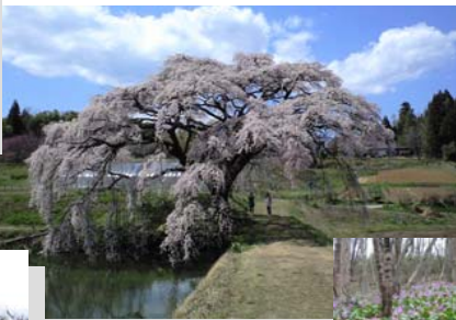
⑦芳水の桜 見頃：4月中旬