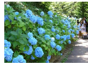
④土合館公園 (あじさい小路) 見頃：6月下旬～7月上旬