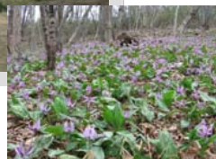
⑥カタクリの里 見頃：4月上旬