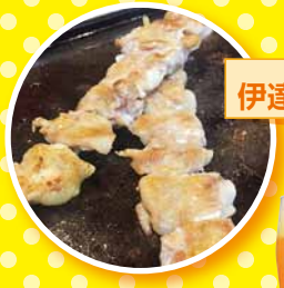
おとこぐし 伊達の漢串